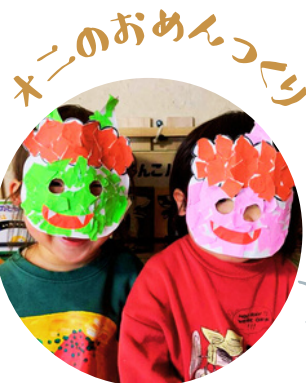
ネーのおめんつくり