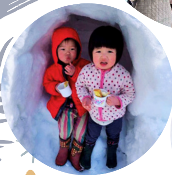
かまぐらのなかで おやつタイム♪