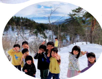
カンカン渡りで 山頂へ 米沢の町を一望 できたよ!