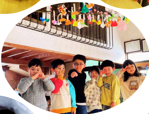
もちつきたいかい