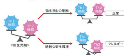
— 図4 Th1細胞とTh2細胞のバランス —