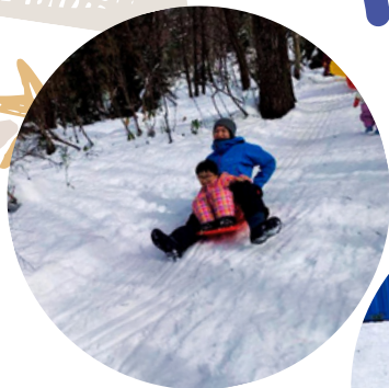
めいっぱい 雪あそび☆